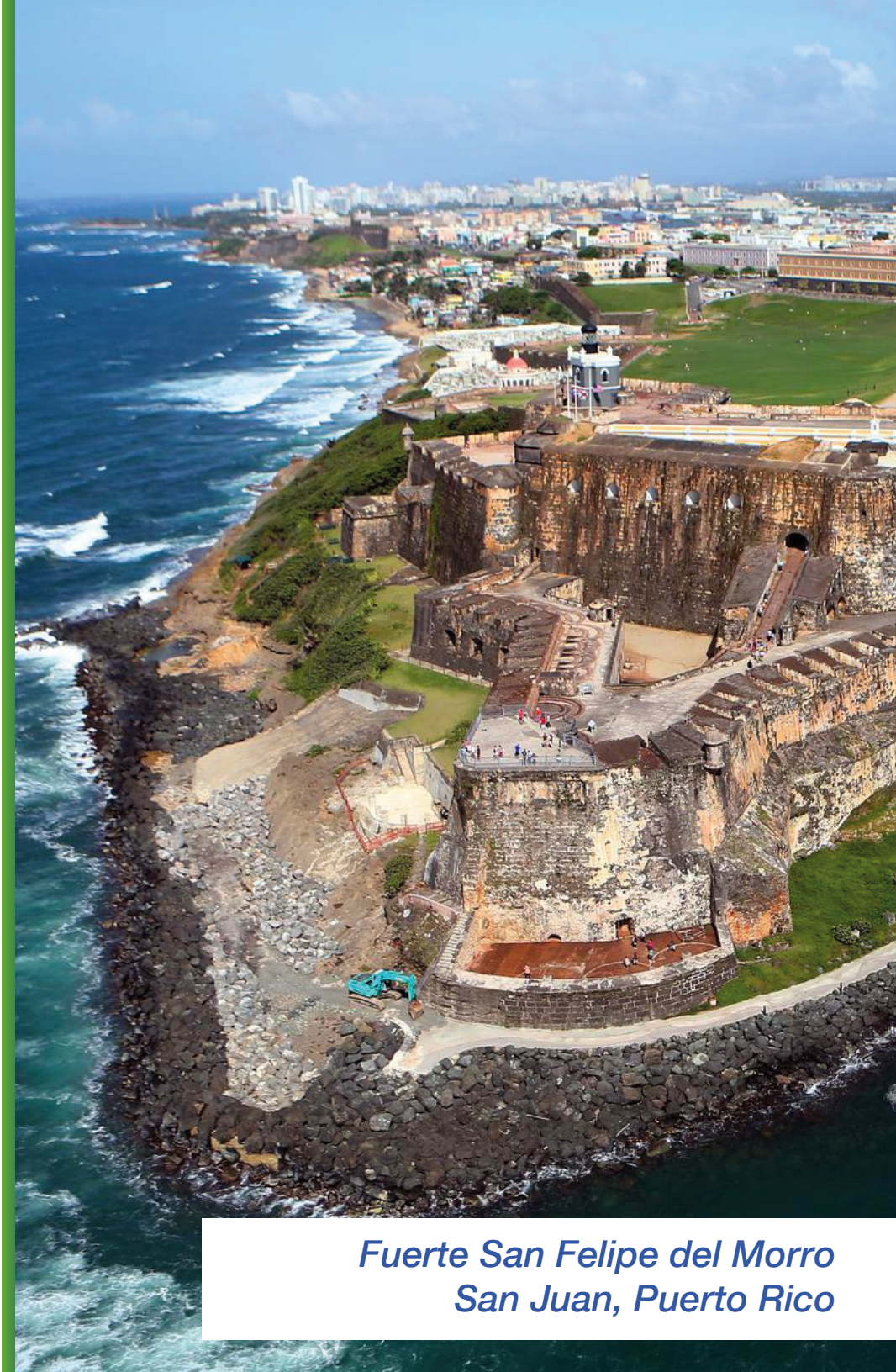
Fuerte San Felipe del Morro San Juan, Puerto Rico